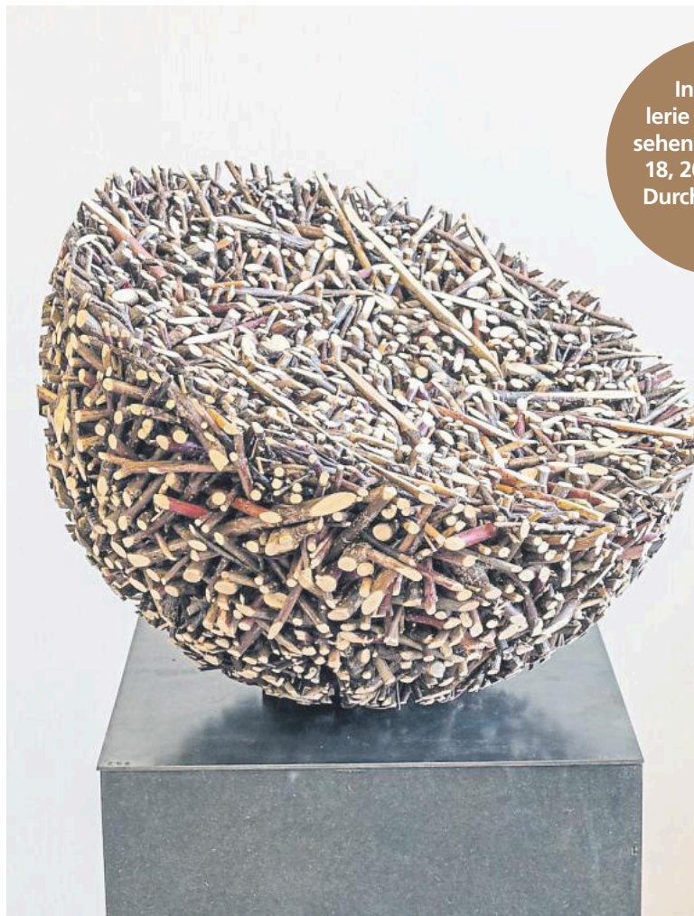
In der Galerie Kersten zu sehen: LIED O258-18, 2018, Reisig, Durchmesser ca. 46 cm

Beim Anblick der Skulpturen drängen sich Schlagworte auf, die Gegensätze ausdrücken: Ordnung und Chaos, Rauheit und Glätte, Natur und Technik – all das subsumiert unter dem Oberbegriff der Reinen Ästhetik. Die Objekte bestechen durch ihre Eleganz und erstaunen durch das verwendete Material, das für einen Künstler alles andere als üblich ist – Reisig.