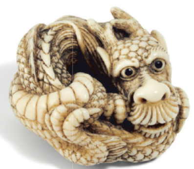
Netsuke eines zusammengerollten Drachens Japan | Edo-Zeit | 19. Jh. | Elfenbein | H. 2,6 cm Ergebnis: € 18.000